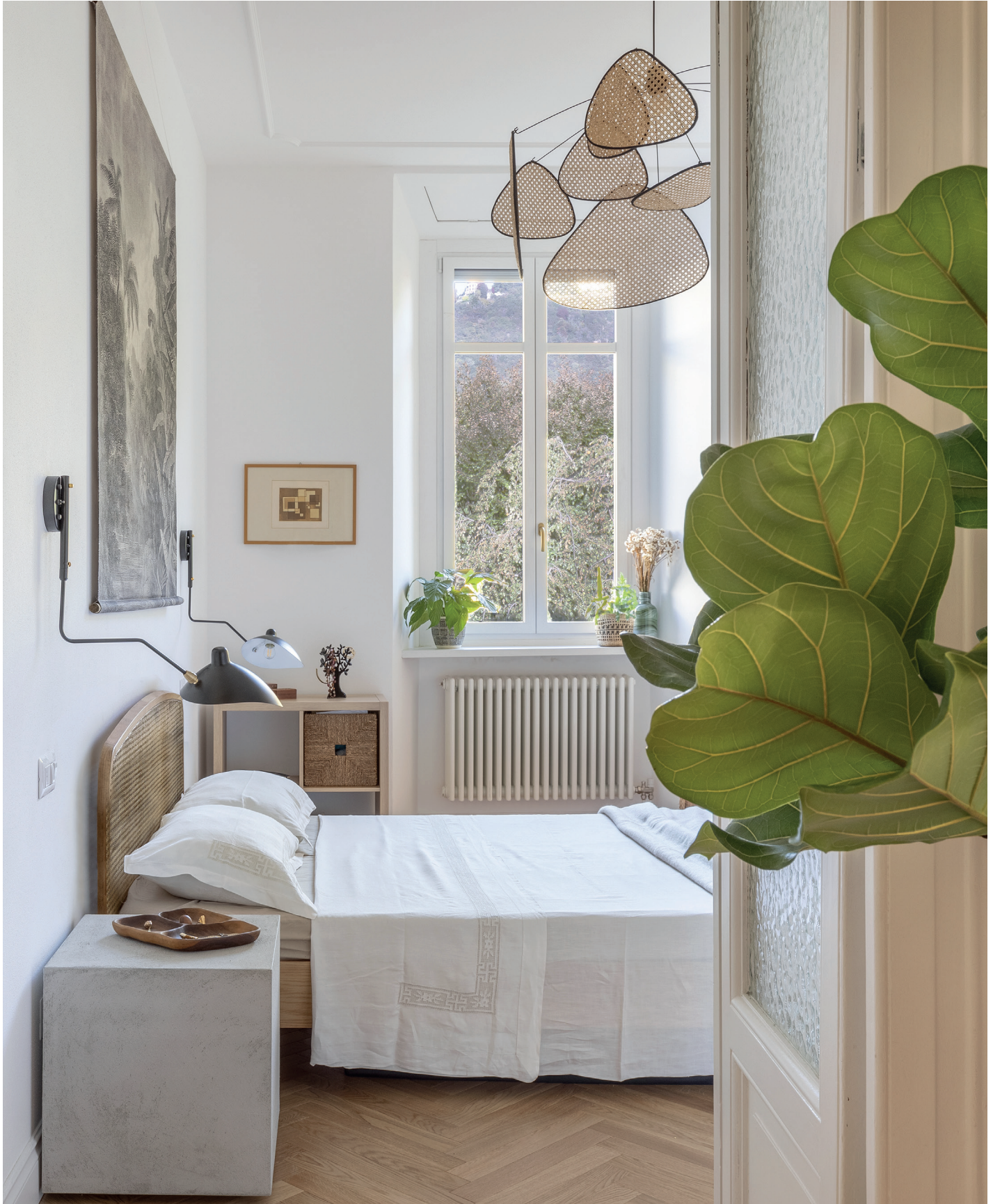
CASA NATURALE 123